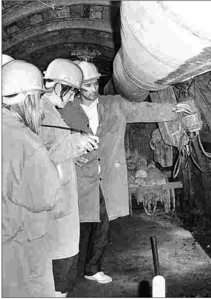
Ausflug in die Unterwelt: Die Exkursion der Studenten führte auch in eine Kohlengrube bei Walbrzych.